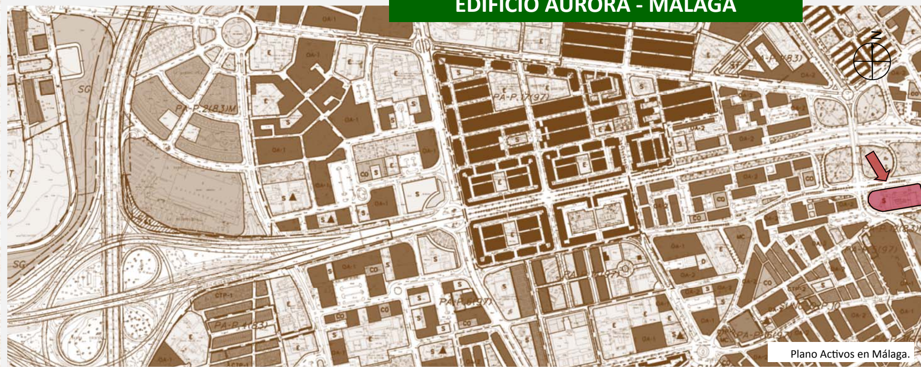
Plano Activos en Málaga.