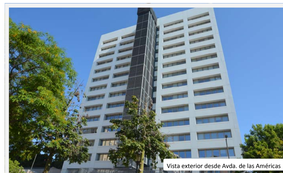
Vista exterior desde Avda. de las Américas