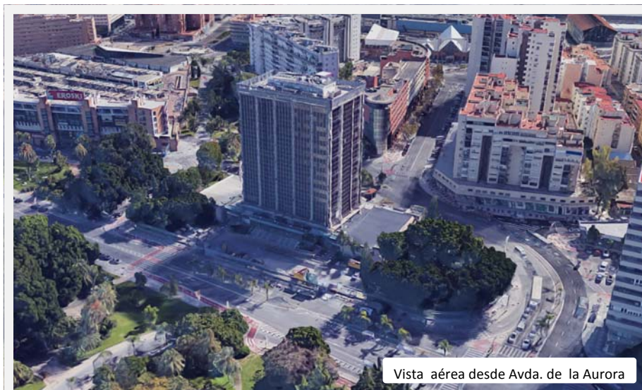
Vista aérea desde Avda. de la Aurora