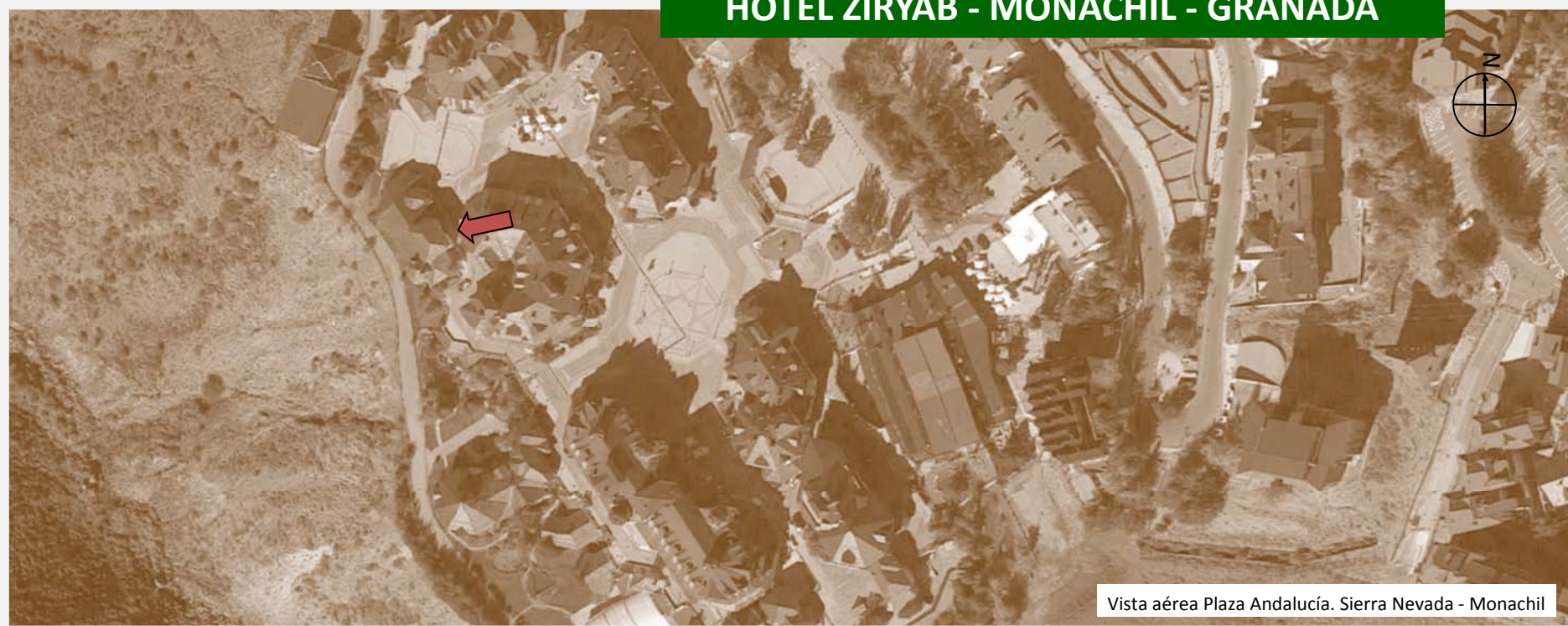
Vista aérea Plaza Andalucía. Sierra Nevada - Monachil