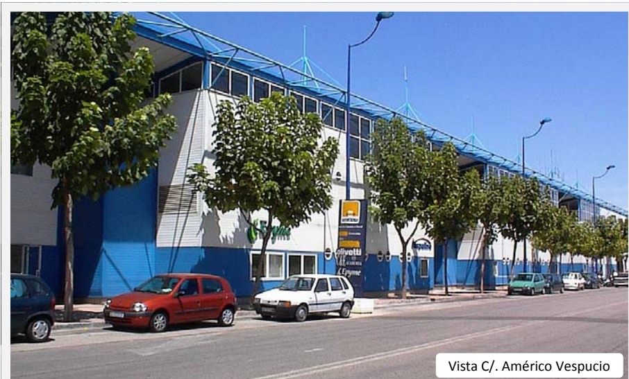
Vista C/. Américo Vespucio