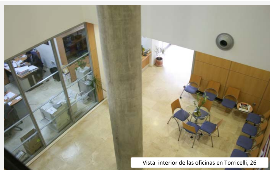
Vista interior de las oficinas en Torricelli, 26