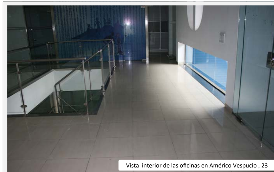
Vista interior de las oficinas en Américo Vespucio, 23