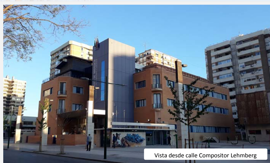
Vista desde calle Compositor Lehberg