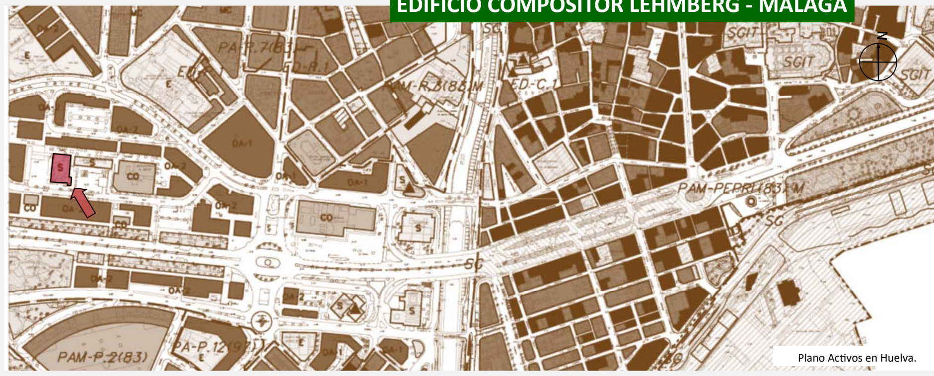
Plano Activos en Huelva.