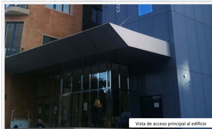
Vista de acceso principal al edificio