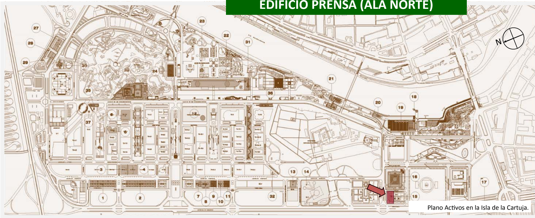
Plano Activos en la Isla de la Cartuja.