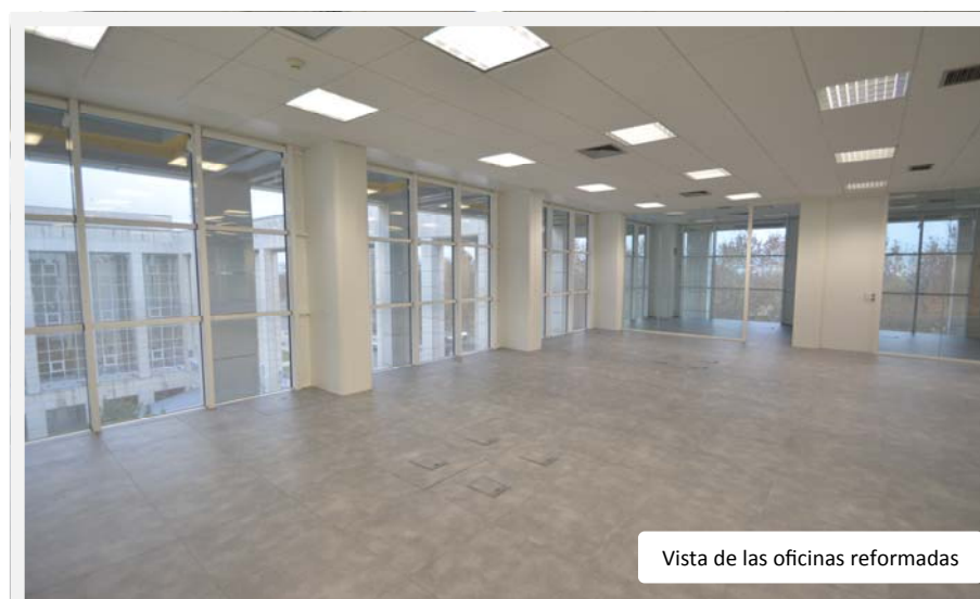
Vista de las oficinas reformadas