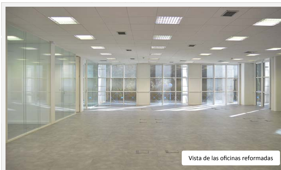
Vista de las oficinas reformadas