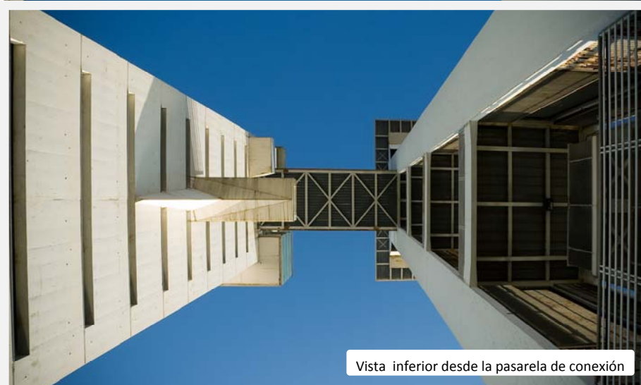
Vista inferior desde la pasarela de conexión