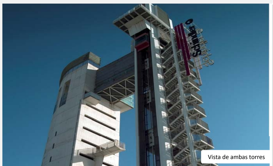
Vista de ambas torres